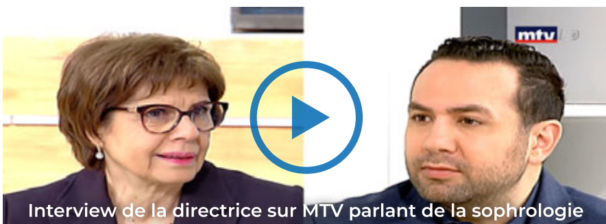
Interview de la directrice sur MTV parlant de la sophrologie